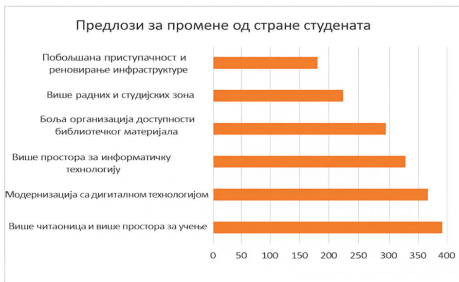
Графикон бр.1: Предлози за промене у вези са библиотечким простором од стране студената

На питање које су најважније промене или побољшања која би желели да виде у организацији библиотечког простора у универзитетској библиотеци, студенти су најчешће одговорили: више простора за учење (72,6%), модернизација са дигиталном технологијом (66,8%), више простора за информатичку технологију (64,1%), боља организација доступности библиотечког материјала (55,8%), више радних и студијских зона (30%), побољшана приступачност и реновирање инфраструктуре (26,6%) и друго (0,9%). (графикон бр. 1).